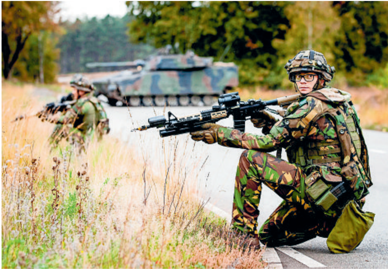
Infanteristen tijdens de oefening Zebra Sword van de Nederlandse landmacht

Hij zegt altijd al interesse te hebben gehad in buitenlandse politiek en defensievraagstukken, maar nu een punt te hebben bereikt dat hij het niet meer kan aanzien. 'Misschien ben ik een donquichot, maar die jarenlange bezuinigingen gaan ons nu pijn doen. Nederlanders denken altijd dat macht en kracht er niet toe doen in de wereld, en zijn verbaasd over Trump of over de Franse aanpak bij Air France-KLM.